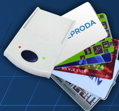
Lector de proximidad

Ideal para establecer promociones por tickets de venta en tienda o lectura de cupones de descuento.