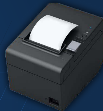
Impresora térmica de tickets de alta velocidad

Permite incorporar un lector de proximidad para que la identificación, fidelización o descuentos se produzcan al acercar un dispositivo sin contacto (llaveros, tarjetas o pegativas). Estos soportes son mucho más robustos y duraderos que la tarjeta de banda magnética tradicional.