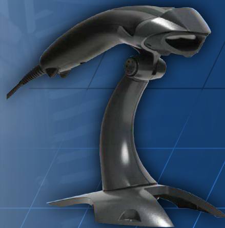
Lector de código de barras integrado

Lector de sobremesa para la lectura de tarjetas de fidelización, descuentos o crédito local. No apto para tarjetas bancarias.