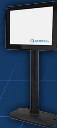
Visor de precios

Apertura automática al cobrar en efectivo. También se puede abrir mediante pulsación del botón de caja en pantalla. Dispone de cerradura con llave adicional.