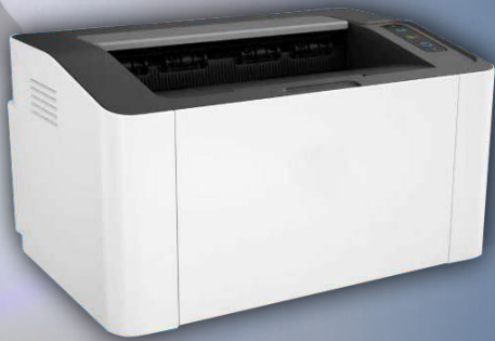
Impresora láser en formato A4

Ideal para la impresión de facturas, cierres de turno y otros informes accesibles desde el punto de venta.